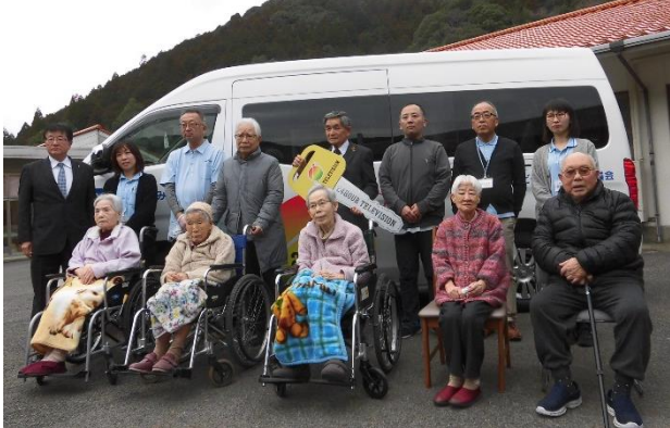
贈呈式後に、入所者の皆さんと