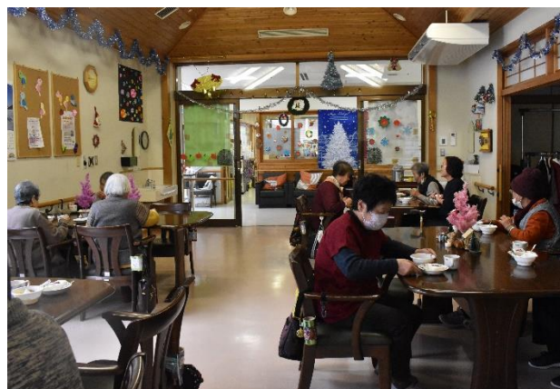
楽しくクリスマス会