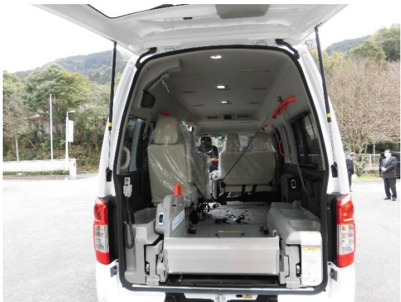
車いす2台分が乗る車内