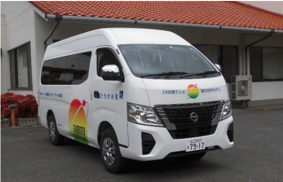
贈呈された福祉車両

贈呈された車両は、入所者・利用者の皆さんの地域行事への参加や医療機関の移動手段など有効に活用させていただく事としています。